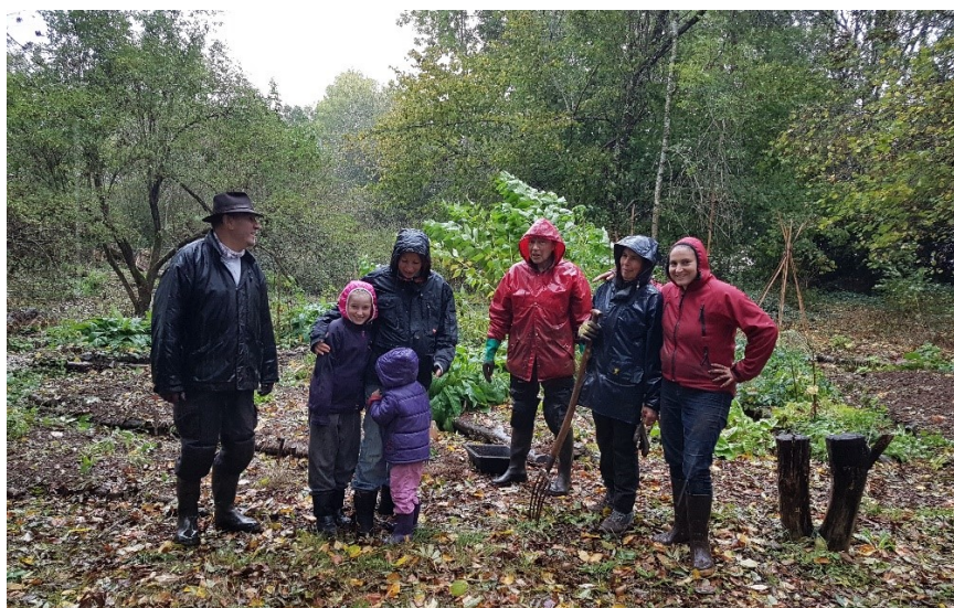
Photo de nos courageux bénévoles sous la pluie d'automne 2023