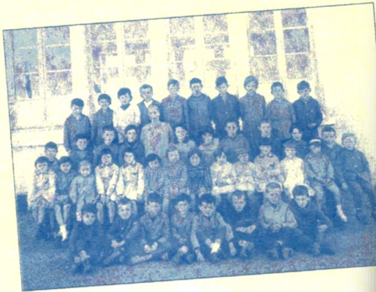
Ecole communale d'Avèze 1964 ou 1965

Nous publions ci dessous deux photos de l'école communale d'Avèze dont les dates de prises de vue ont été estimées . Si l'un de vous se souvient et a des précisions a apporter sur ces clichés, nous serons heureux de les collecter afin d'enrichir la mémoire collective de notre commune