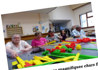
Confection des fleurs pour nos magnifiques chars fleuris