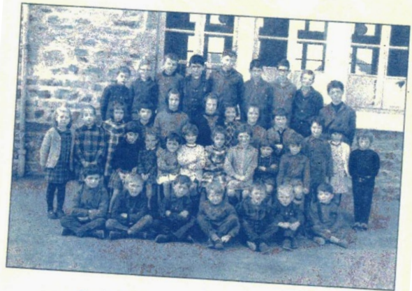
Ecole communale d'Avèze 1967 ou 1968